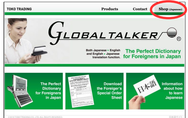
Photographs and the layout may be changed.

2) Click "Elec. Dictionary / Translator" or photos.