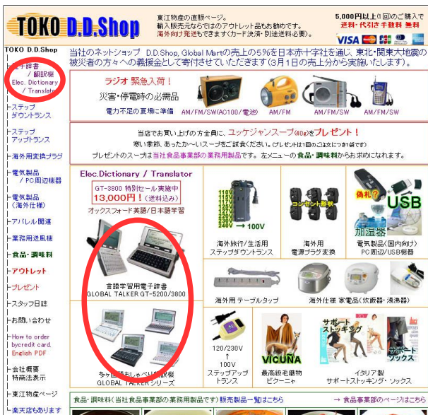
Photographs and the layout may be changed.

3) Click a model number or a photograph, and select a model