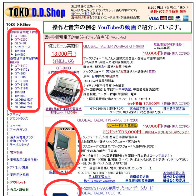
Photographs and the layout may be changed.

4) Enter quantity and click "購入する"(buy).